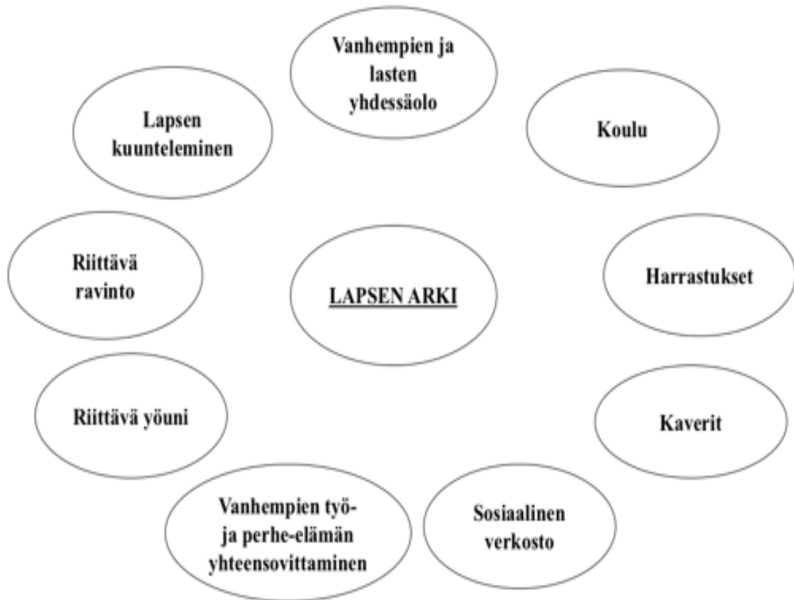
Kuvio 2. Lapsen arkirutiinit ja arjen toimintaympäristöt. (Mukaillen Kyrönlampi-Kylmänen 2010)