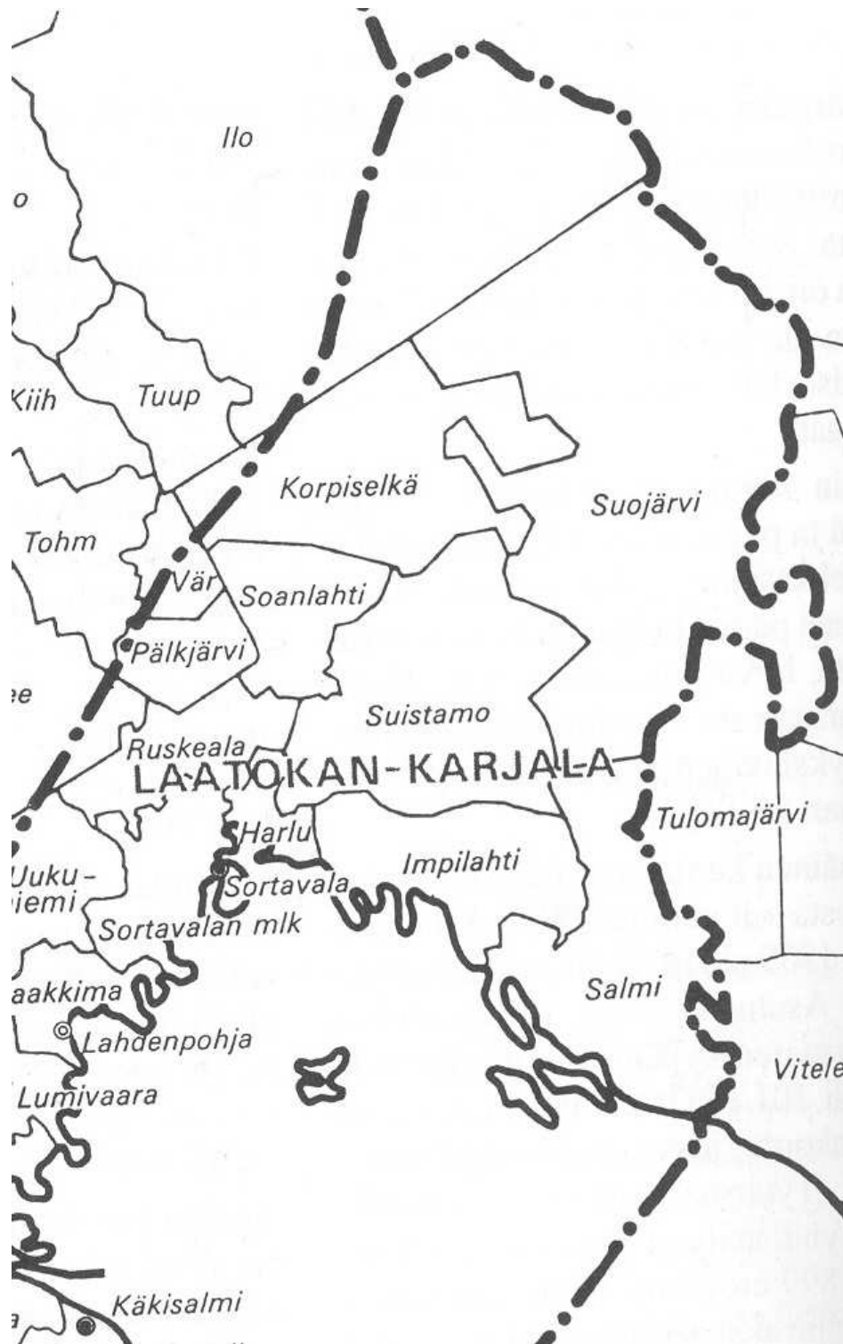
Liite 3. Raja-Karjala ennen talvisotaa.