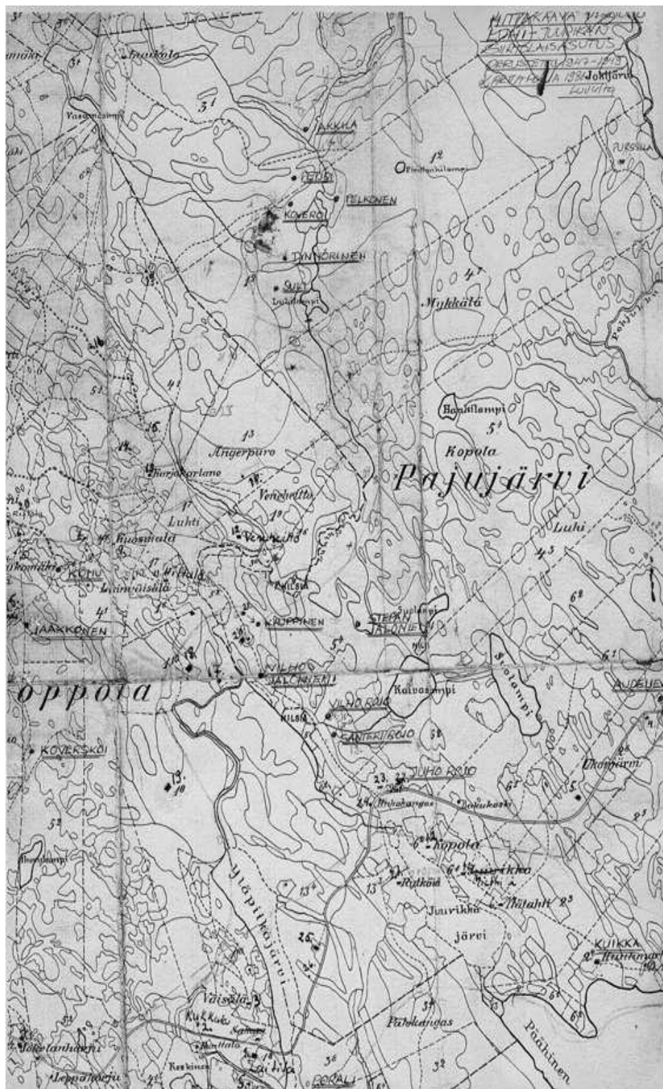
Liite 6. Luhi- ja Juurikan kylään asettuneet siirtokarjalaiset 1947–1949.