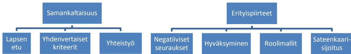
KUVIO 2. Keskeiset käsitteet

Sisällönanalyysin jälkeen palasin vielä kirjoitusten kohtiin, joissa vastaajat toivat esille kokemuksiaan omasta tietämyksestään sateenkaariperheistä ja koulutuksen antamista valmiuksista kohdata erilaisia perhemuotoja. Poimin teemaan liittyvät ilmaisut ja käsitteet ne pelkistäen ja kvantifioiden eli muutin tiedot tunnusluvuiksi. Tunnuslukujen avulla loin vastaajien taustatekijöistä yhteenvedon.