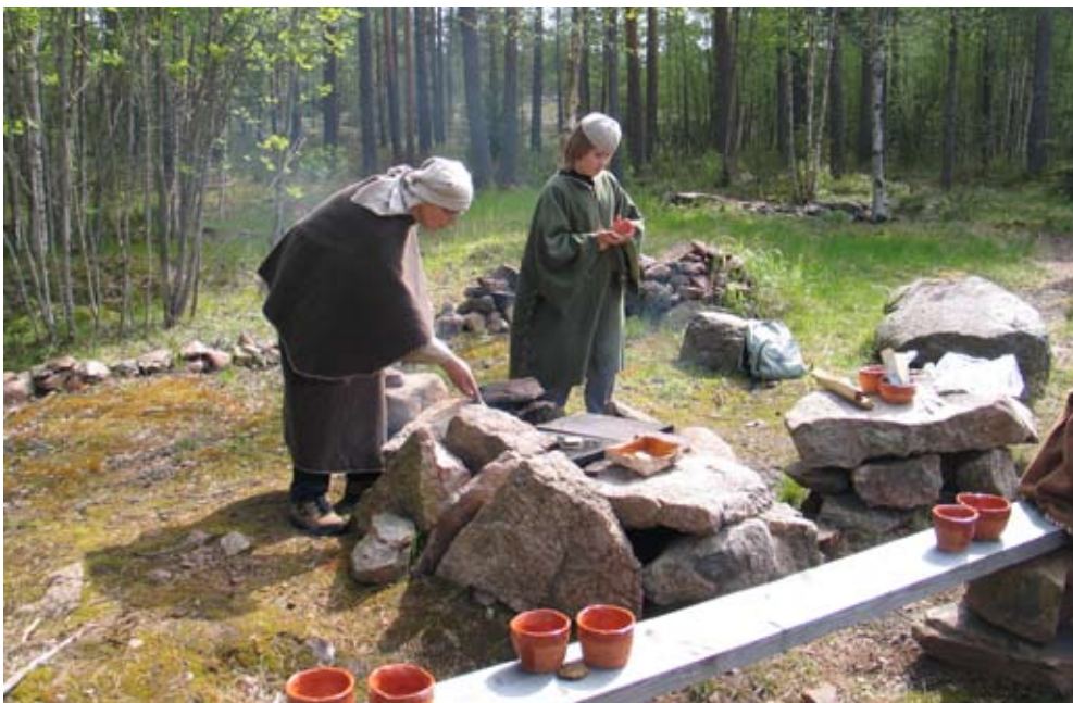
Kuva 2. Herneleipää paistetaan kivellä

Sammallahdenmäellä vierailevat voivat varata opastuksen numerosta +358 44 387 2136 / Ulla Antola. Ryhmille voidaan järjestää erilaista ohjelmaa ja tarjoilua toivomusten mukaan. Perinneyhdistys Keritys on paneutunut pronssikauden elävöittämiseen ja järjestää toimintaa sekä tarjoilua alueen etelälaidalla olevan riihen ympäristössä. Kaikki pyritään toteuttamaan niin kuin se olisi ollut mahdollista jo ”pronssise mailma aika”. Perinneyhdistys Keritys esittäytyy sivuilla www.keritys.fi .