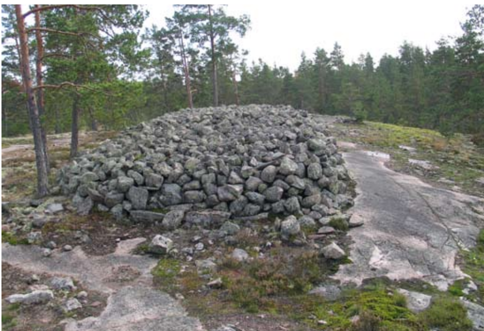
Kuva 1. Huilun pitkä raunio

Alueen 36 tunnettua hautaröykkiötä jäkälän peittämällä kallioilla muodostavat näyttävän kokonaisuuden, jossa ovat edustettuina pronssikauden erilaiset röykkiötyypit: matalat, pyöreät pikkuröykkiöt, suuret kekomaiset hiidenkiukaat ja pyöreät kehäröykkiöt. Kallioiden länsipuolella pilkottaa Saarnijärvi, joka oli vielä merenlahti pronssikaudella, jolloin vesi lainehti lähes 30 metriä nykyistä korkeammalla. Nykyään Saarnijärvi on myös lintuvesien suojelualue, jolta usein kantautuu ainakin kurkien ja joutsenien ääntely kauemminkin.