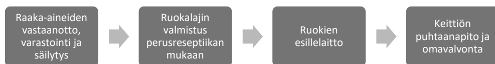
Kuvio 2. Näytön kuvaus. Ravintolan keittiötoiminnot, 20 ov

Kokkiopinnoissa verkko-opetus (mahdollisuuksineen) hakee kuitenkin vielä muotoaan, sillä oppimisprosessi halutaan nähdä sekä osaamisen tilassa tapahtuvana muutoksena, että ihan konkreettisesti. Oppimisen havaitseminen on mahdollista koska ruoan valmistus on fyysinen prosessi. Aineistossa prosessin tuloksiin viitataan usein ”käden taitoina”. Manuaaliseen työhön kasvattaminen kiinnittää ajan paitsi työn vaiheiden ja fyysiseen prosessin, myös ajattelun järjestämiseen. Liikkeen ohella tekemisessä korostuu aika työnä. Kokkien koulutusohjelmassa taito organisoida ja ajatella tuleva työ etukäteen mainitaan yleisesti ammattiin kouluttamisen ydintehtäväksi. Kokkien perustutkinnossa tämä ajatus on siirretty myös työn järjestämisen malliksi. Vuosien 2009-2012 opetussuunnitelmaperusteissa Ravintolan keittiötoiminnot –opintokokonaisuus kiinnittää kokin keskeisen osaamisen ruoan valmistusprosessiin.