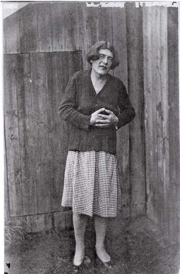
Kuva 2. Kettunen isä Stalinina